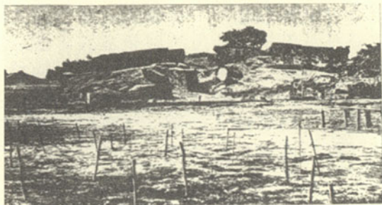
圖二 被英艦轟毀的安平古堡