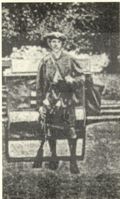
圖三 1860年代的必麒麟

雖然美國駐廈門領事李讓禮，很贊成英艦砲轟並占領安平，但是美國駐北京公使反對；尤其由於副領事館英國政府不支持吉必勳所為，所以最後是和平了結。吉必勳調職到汕頭，船一靠岸，吉必勳便積憤成疾，一病不起，未及上任汕頭副領事，便告死亡。清廷在此事件後，始覺悟「台灣孤懸海外，非為守兼優之員不克勝任」，殊不知山雨欲來風滿樓。