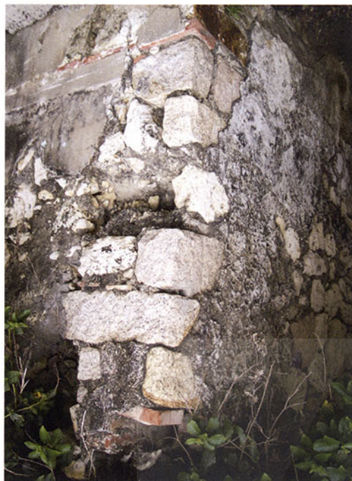
圖 3-2 羅賓奈洋行倉庫遺構